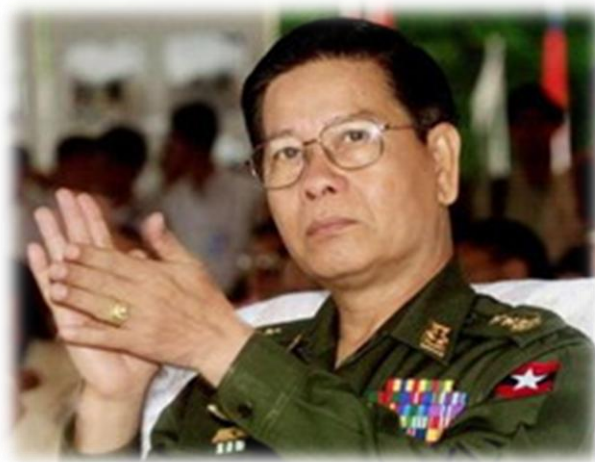
จิ้น ชุ่น อดีตนายกรัฐมนตรีของรัฐบาลทหารพม่า

1.4 เมื่อวันที่ 30 สิงหาคม 2546 พลเอก จิ้น ชุ่น นายกรัฐมนตรีคนใหม่ของพม่าได้ประกาศแนวทางการดำเนินการไปสู่กระบวนการปรองดองแห่งชาติและประชาธิปไตย (Roadmap) ในพม่า เพื่อแก้ไขปัญหาทางการเมืองภายในประเทศและแรงกดดันจากประชาคมระหว่างประเทศ ทั้งนี้ ภายหลังจากการประกาศแนวทางดังกล่าว รัฐบาลพม่า ได้ดำเนินการจัดตั้งคณะกรรมการต่างๆ ตั้งแต่วันที่ 6 กันยายน 2546 เป็นต้นมา เพื่อดูแลการจัดประชุม National Convention และได้อนุญาตให้นางออง ซาน ซู จี กลับไปพักอยู่ที่บ้านพักของตนเอง เมื่อวันที่ 26 กันยายน 2546