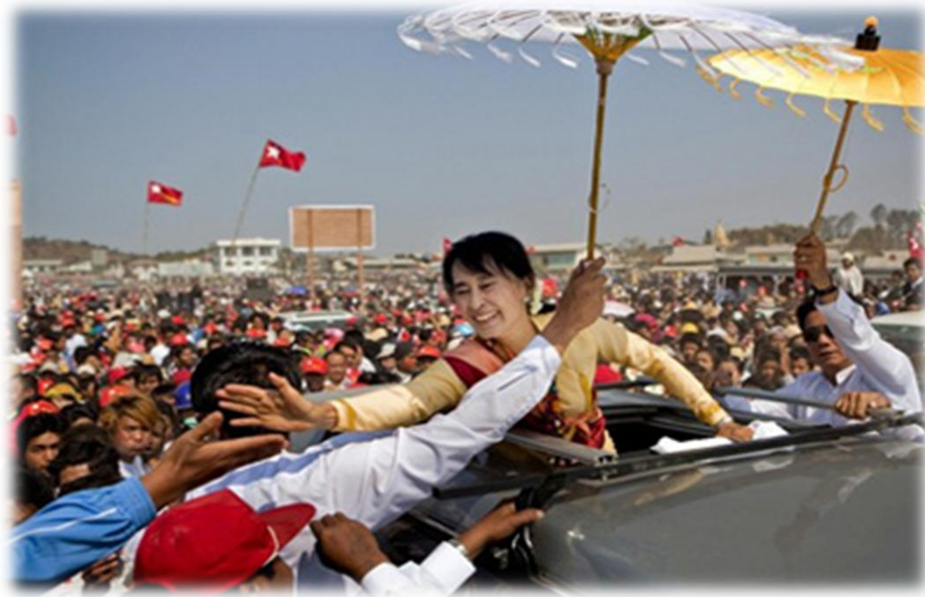
นางออง ซาน ซูจี ผู้นำพรรค NLD

1. ด้านการเมือง ปัญหาทางการเมืองภายในพม่าขณะนี้ มีรากมาจากความผันผวนของ กระบวนการเปลี่ยนแปลงทางการเมืองและเศรษฐกิจของพม่า ในช่วงกลางและปลายทศวรรษที่ 1980 โดยเฉพาะกระแสการเรียกร้องให้มีการเปลี่ยนแปลงทางการเมืองไปสู่ระบอบ ประชาธิปไตยแต่ถูกฝ่ายกองทัพซึ่งเป็นกลุ่มอำนาจเดิมทำการปราบปรามอย่างรุนแรงเมื่อปลาย ค.ศ. 1988 การจัดตั้งรัฐบาลทหารซึ่งกุมอำนาจอย่างเบ็ดเสร็จ และมีการกระทำที่เป็นการละเมิดสิทธิมนุษยชน โดยเฉพาะ การจับกุมตัวนางออง ซาน ซูจี และสมาชิกพรรค National League for Democracy (NLD) ทำให้สถานการณ์ทางการเมืองในพม่าเป็นปัญหาระหว่างประเทศเรื่อยมา