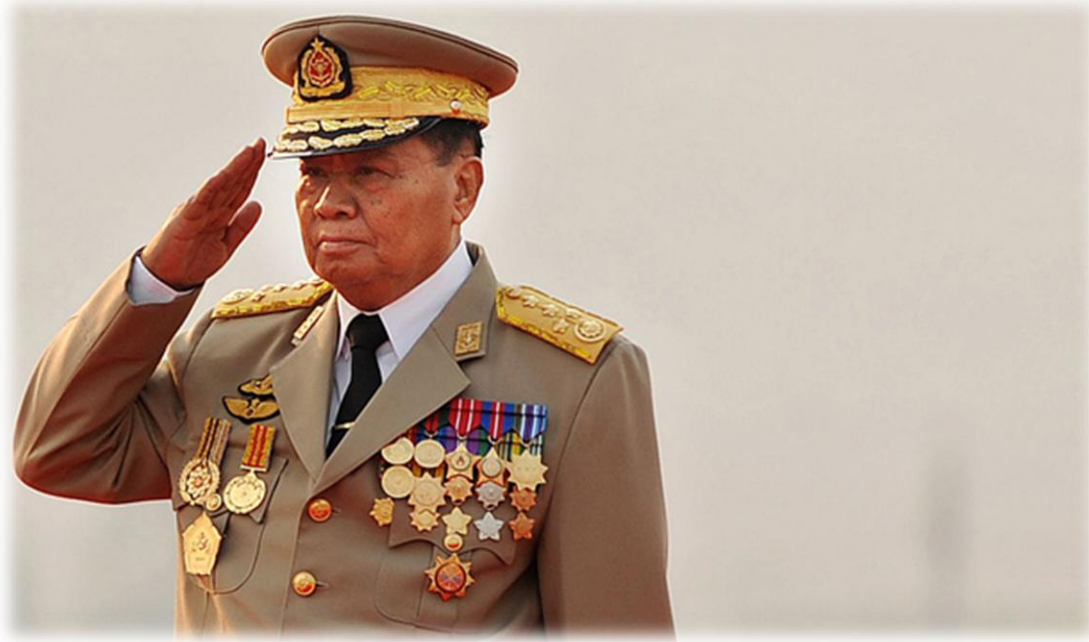
พลเอกอาวุโส ตานฉ่วย ผู้นำสูงสุดของประเทศสหภาพพม่า