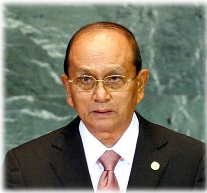
ประธานาธิบดี เต็ง เส่ง

1.3 หลังจากที่เกิดอยู่ในกระแสการ กดดันจากประชาคมระหว่างประเทศ โดยเฉพาะอย่างยิ่งมาตรการลงโทษของสหรัฐฯ ซึ่งส่งผลให้ เศรษฐกิจของพม่าอยู่ในสภาวะวิกฤติอย่างรุนแรง นั้น เมื่อวันที่ 25 สิงหาคม 2546 รัฐบาลพม่าได้ ประกาศปรับเปลี่ยนตัวบุคคลในรัฐบาลพม่าหลาย ตำแหน่ง ที่สำคัญได้แก่ การแต่งตั้งพลเอก ชิ่น อู้น เป็นนายกรัฐมนตรี พลโท โซ วิน เป็นเลขาธิการ 1 และ พลโท เต็ง เส่ง เป็นเลขาธิการ 2 ของสภา สันติภาพและการพัฒนาแห่งรัฐ ทั้งนี้ การแต่งตั้ง พลเอก ชิ่น อู้น ขึ้นดำรงตำแหน่งนายกรัฐมนตรี นั้น น่าจะสืบเนื่องมาจากพลเอก ชิ่น อู้น เป็นผู้ มีทักษะในการเจรจาและถูกมองว่าเป็นผู้ที่มี ความคิดเป็นกลาง (moderate)