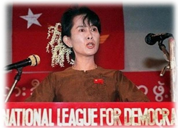
นางออง ซาน ซูจี

ประเทศพม่าได้จัดการเลือกตั้งทั่วไปขึ้นในวันที่ 7 พฤศจิกายน 2553 แม้ว่าในระหว่างนั้นจะมีเหตุการณ์ที่เป็นอุปสรรคต่างๆ นานา เกิดขึ้น เช่น การคว่ำบาตรการเลือกตั้งของพรรคสันนิบาตแห่งชาติเพื่อประชาธิปไตย หรือ NLD (National League for Democracy) นำโดย นางออง ซาน ซูจี จนนำไปสู่การถูกยุบพรรค หรือการวิพากษ์วิจารณ์ของสื่อตะวันตก ถึงความไม่โปร่งใสและไม่เชื่อ มั่นในการเลือกตั้งในพม่า