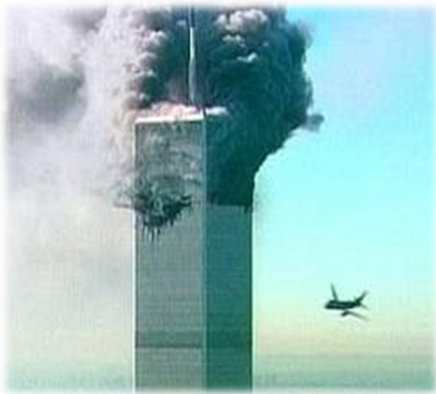
สลัดอากาศจี้เครื่องบินพุ่งชนตึกแฝดของเวิลด์เทรดเซ็นเตอร์