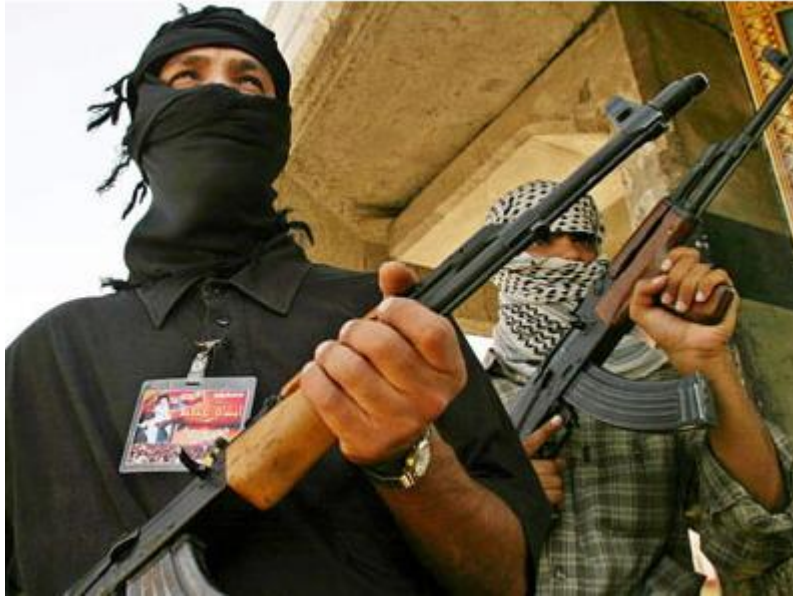
ขามุสลิมในประเทศอัฟกานิสถานร่วมต่อต้านรัฐบาลในสงครามไร้รูปแบบ