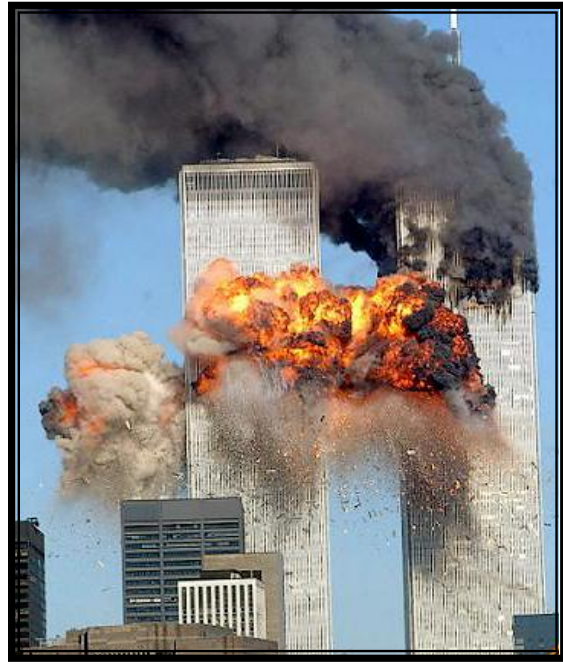
นครนิวยอร์ก สหรัฐอเมริกา 11 กันยายน ค.ศ. 2001