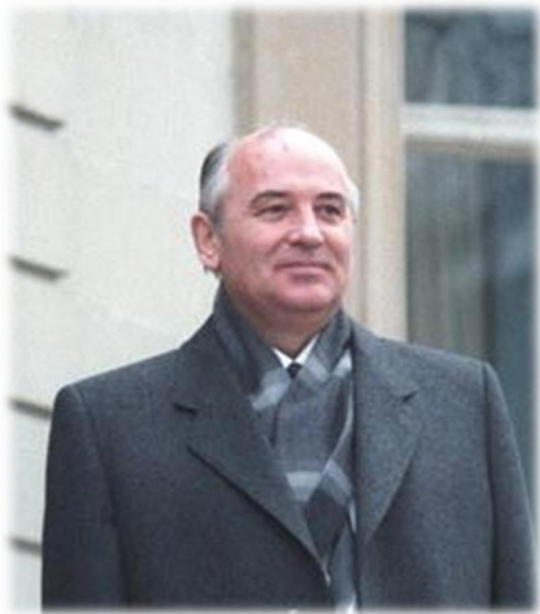
มิคาอิล กอบาชอฟ ผู้นำการเปลี่ยนแปลงที่ทำให้สหภาพโซเวียตเสื่อมสลาย