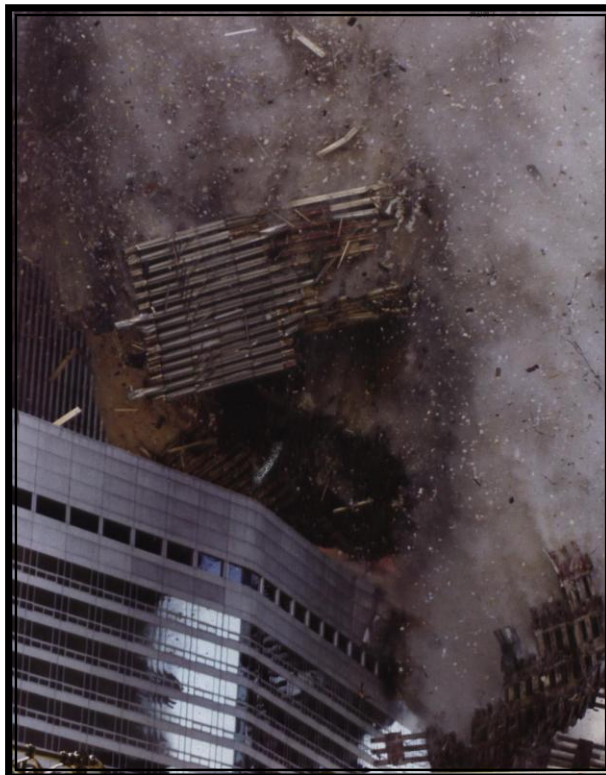
อาคารเวิลด์เทรดเซ็นเตอร์สูงเป็นอันดับสองของโลก กำลังพังทลาย 11 กันยายน ค.ศ. 2001

2. นิวยอร์ก เป็นสาเหตุหลักและอธิบายความอัปยศของวิธีการที่ผู้ถูกกดขี่ในตะวันออกกลาง นำมาใช้ในการต่อสู้กับสหรัฐอเมริกา เพราะการก่อการร้ายคือการต่อสู้ของผู้ไร้พลังที่มองว่าไม่มีทางเลือก วิธีการแก้ปัญหา “ การก่อการร้าย ” ไม่ใช่การถล่มในอัฟกานิสถาน หรือ สงครามที่ไหนต่อไปเรื่อยๆ หรือการหามาตรการแบบ “ รักษาความปลอดภัย ” มาต้านการก่อการร้ายซึ่งเป็นเรื่องที่ทำได้ยาก