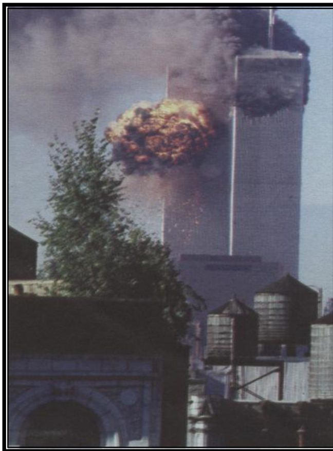
18 นาที หลังจากตึกเวิลด์เทรดหลังแรกระเบิดเครื่องบิน ลำที่สอง ก็พุ่งชนตึกเวิลด์เทรดได้ 11 กันยายน ค.ศ. 2001

นักวิชาการชื่อ Noam Chomsky ให้ความเห็นว่า “ การกระทำของสหรัฐอเมริกาจะ นำไปสู่โศกนาฏกรรมรอบต่อไปอีก ขณะนี้เรามีทางเลือกสองทางคือ เราจะพยายามเข้าใจสาเหตุ หรือจะปิดหูปิดตา และสร้างสถานการณ์ที่เลวร้ายยิ่งขึ้นในอนาคต ” การจะกำจัดการก่อการร้ายในโลก คือการต้องกำจัด วัฒนธรรมความป่าเถื่อน และหลั่มล้าที่มาจาก นโยบายต่าง ประเทศของสหรัฐอเมริกาและมหาอำนาจ อื่นๆ และในขั้นตอนแรก เราควรคัดค้านการทำสงครามของสหรัฐอเมริกา ซึ่งวิธีการที่ดีที่สุด คือ