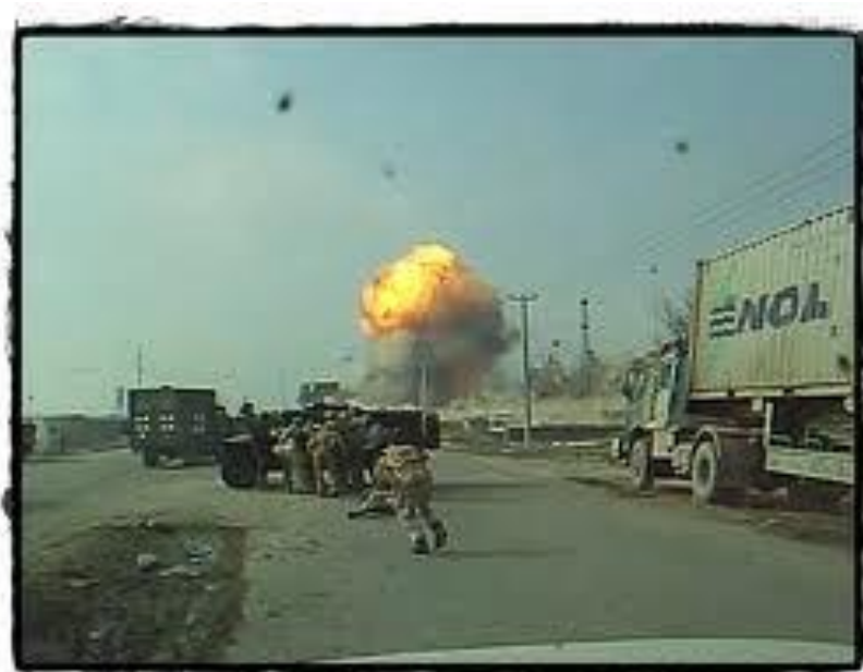
เหตุระเบิดคาร์บอมบ์ในอัฟกานิสถาน