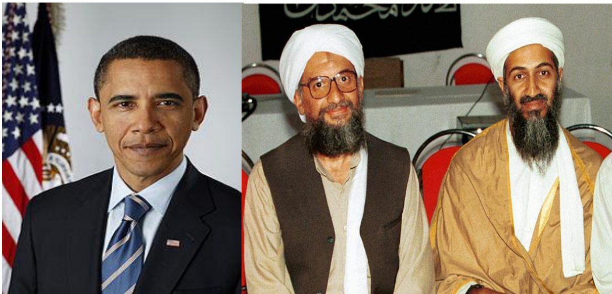
บารัค โอบามา ประธานาธิบดีสหรัฐอเมริกา ผู้สั่งการปฏิบัติการจับตัวนายบินลา เดน

รายงานว่า ก่อนที่ C.I.A. จะสนับสนุน โอซามา บิน ลาเดน ชาวมุสลิมเลิกใช้คำว่า “ จิฮัด ” (สงครามเพื่อพระเจ้า) มาเกือบ 800 ปีแล้ว เพิ่งมารื้อฟื้นศัพท์ของพวกคลั่งศาสนาคริสต์เมื่อ 800 ปีก่อน เพราะมีการใช้คำว่า “ สงครามครูเสด ” ในยุคนี้